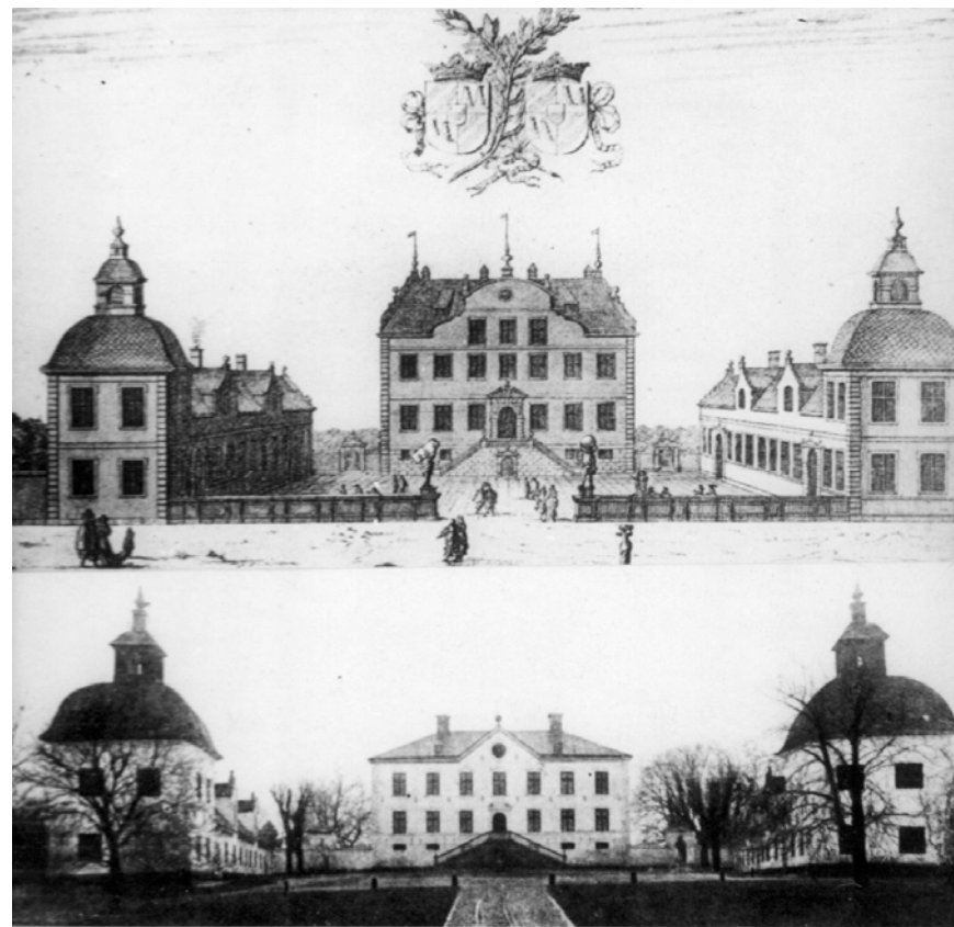
Hässelby vackra slottskupoler

Vi spänna på oss skidorna genast vid stationen och ta av vägen till Hässelby i sydvästlig riktning förbi de eleganta folkskolorna. När vi efter halvannan kilometer passerat konsumtionsföreningens gula hus, ta vi av till vänster vid första vägskälet, och vi äro säkert alls ej ledsna åt denna smula landsvägsåkning, ty som ingen skare nu bär oss, är det tämligen tungt att spåra. Alltså staka vi med glatt mod vidare på denna trevliga väg, och innan vi vet ordet av skymta vi