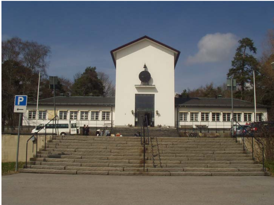
Kapellet vid barnhemmet

Men vi staka rätt över vägen - se upp för alla bilarna! - och fortsätta vår lilla trevliga väg, backe upp och backe ner. Och blott alltför snart susa vi ner för den långa backen strax invid spårvagnshållplatsen i Ålsten.”