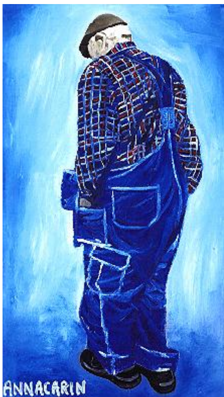
Målning av Annacarin Nykvist