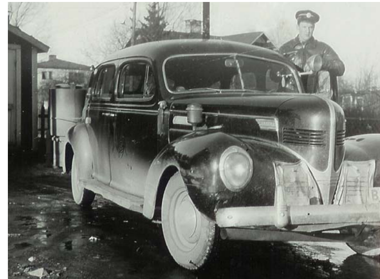
Rune med den gegasutrustade Dodgen utanför droskstationen. Sökarstrålkastaren var ett viktigt hjälpmedel då gatubelysning saknades.

Många företag i Flysta och Spånga blev också stadiga kunder hos Georg och Rune. Ena gången kunde det vara transport av metalldelar en annan gång av levande möss till Karolinska sjukhuset. Rune minns att dessbättre rymde inga av mössen, men doften var inte helt angenäm.