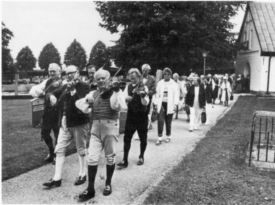
Västerorts Spelmanslag medverkar på Hembygdsgagen

RÅDET för Spånga Fornminnes- och Hembygdsgille