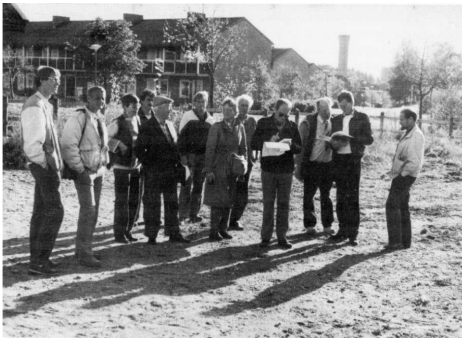
Dussinet fullt slutbesiktigar Nälsta gård