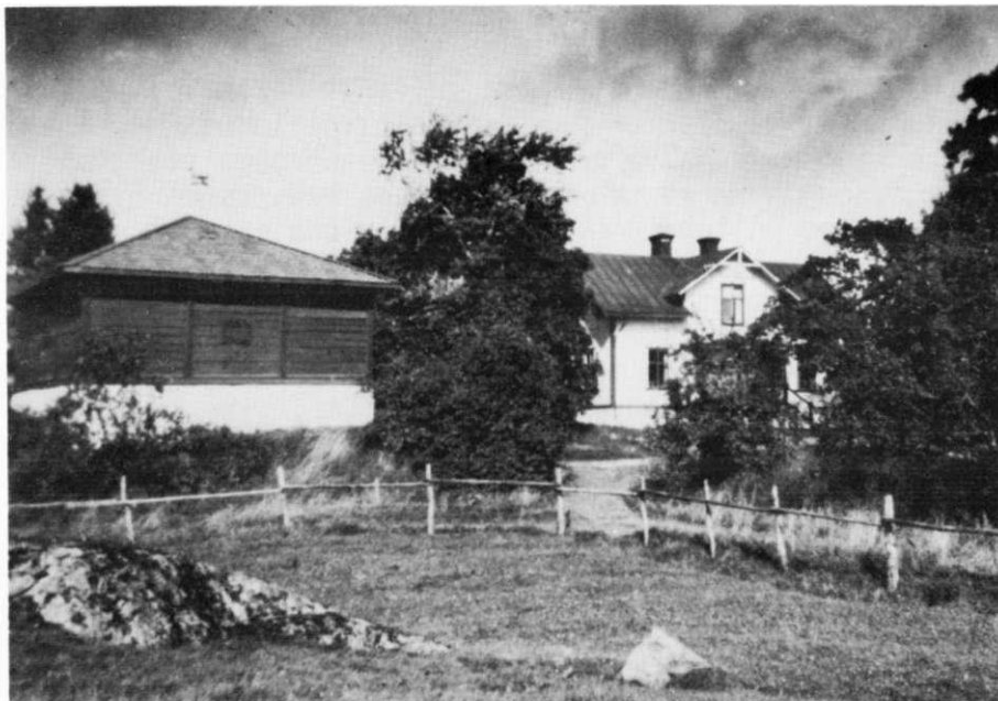
Magasinet och dåvarande mangårdsbyggnaden (nr 6 och 8 på kartan)