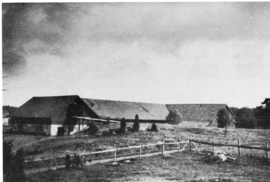
Den pampiga ladugårdsbyggnaden (nr 9 på kartan)