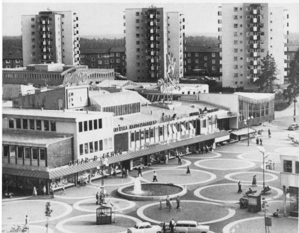
Samma plats mot söder några år senare