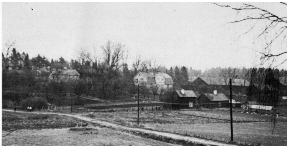
Råsta gård år 1938

Så småningom blev busstrafiken livligare och förlängdes från Barkarby till Jakobsberg. Tågtätheten vid Ulriksdals station hade också ökat. Kontakten med de kommunala myndigheterna var dock fortfarande ett problem, inte minst under kriget då ransoneringskort skulle delas ut. Men det löstes genom att en medlem i kristidsnämnden fick i uppdrag att dela ut kort i sin bostad i Råstahem.