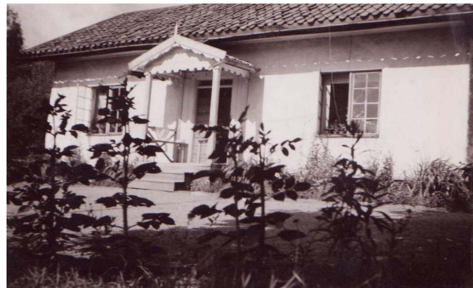
Vårt älskade Johannelund på 1940-talet