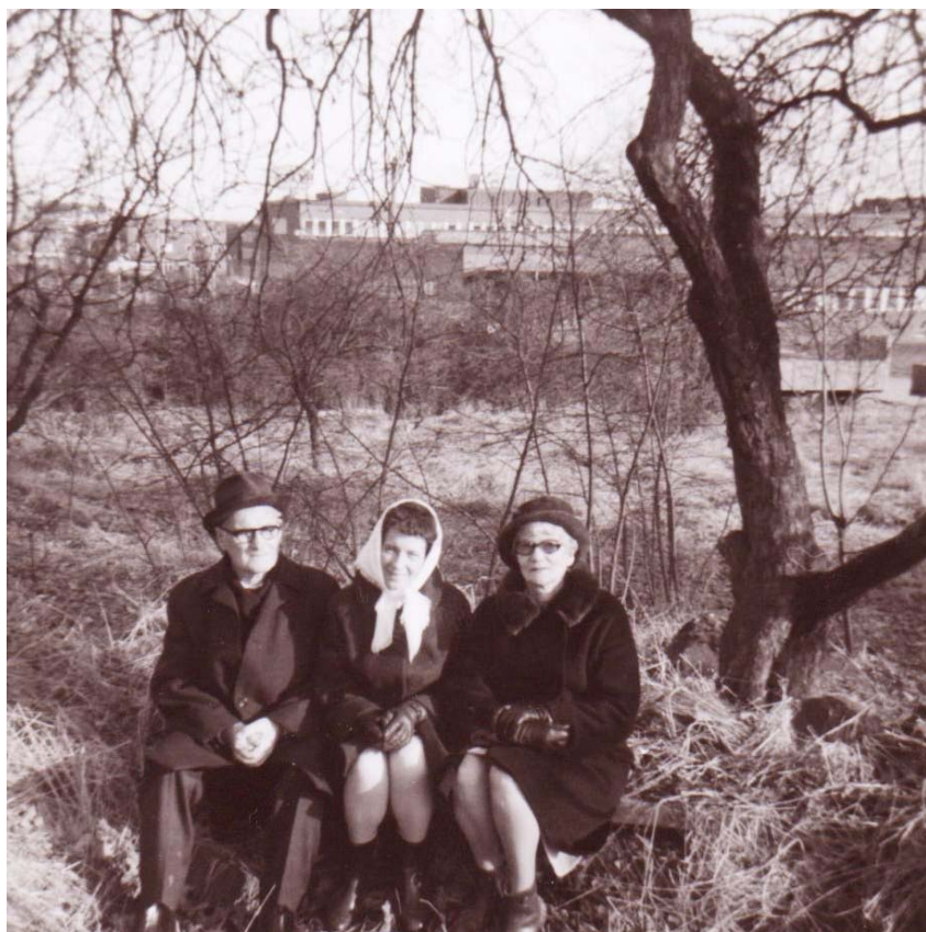
Pappa, Ulla och mamma på platsen för Johannelund 1969.