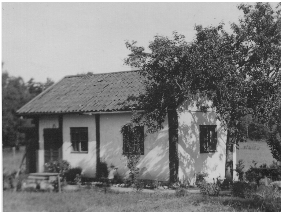
Vita stugan, tillhörande Plaisiren

Att vi hamnade på Johannelund har sin särskilda historia. Genom en arbetskamrat till pappa fick familjen tips om att hyra "Vita stugan" som hörde till Plaisiren. Det var sommaren 1931 och jag var med – ofödd. Vet inte om familjen hyrde även 1932. Jag var på barnhem, för min mamma miste nästan livet när hon gav mig mitt, men jag tror att de var där mer än en sommar.