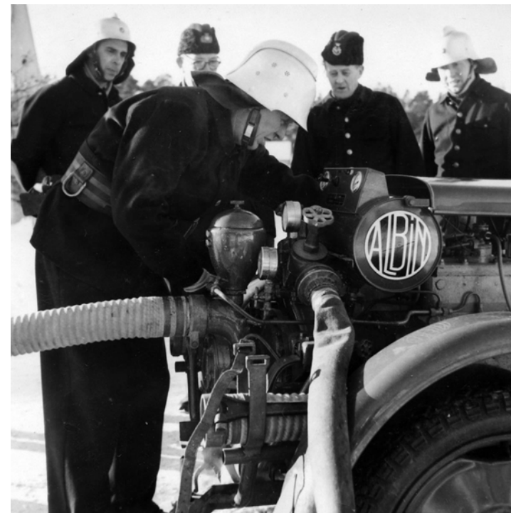
Här ser man den kraftiga pumpen som är monterad längst fram på bilen.

Samma år, 1949, fick man också en vad som kallades släckbil. Det var en motorspruta. Men den fanns inte kvar så länge för 1951 fick man en ”sprillans ny” brandbil, en Ford av årets modell och med registreringsnummer A 14666. Den var då Sveriges modernaste brandbil och brandmän och befäl i Stockholms centrum var avundsjuka och tyckte att den inte borde gå till en sådan avlägsen förort som Spånga utan borde ha placerats i stadens mitt. Eventuellt var den nya brandbilen en ”muta” från stadens befallningshavare för att mildra kvardröjande misstro mot att vi skulle få det bättre i Spånga efter inkorporeringen. Nu hade man något att visa upp.