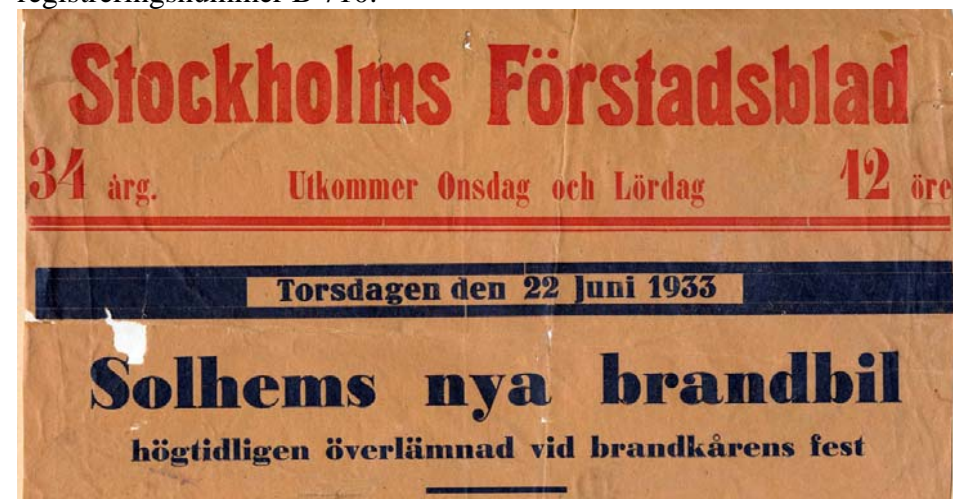
Klipp ur Stockholms Förstadsblad 1933

I flera år var man hänvisad till den gamla utrustningen även om man förbättrade den successivt. Men behovet och önskemålet om en riktig brandbil var stort. Under depressionsåret 1931 genomfördes därför många insamlingar för att kunna köpa in en lämplig brandbil. Man arrangerade fester för allmänheten, s.k. bazarer, nöjesfält med uppträdanden, dans, sång och musik. Man gav t o m ut en tidning för att fira att man lyckats och där kunde man läsa: ”År 1931 i juni anordnade Brandkåren i Solhem festföreställning, varvid överskott och insamlade medel voro avsedda för inköp av Brandredskapsbil. Målet blev nått tack vare stor tillslutning och intresse för saken”. År 1933 inhandlade man en lastbil som byggdes om till den första brandbilen, en Chevrolet, med registreringsnummer B 710.