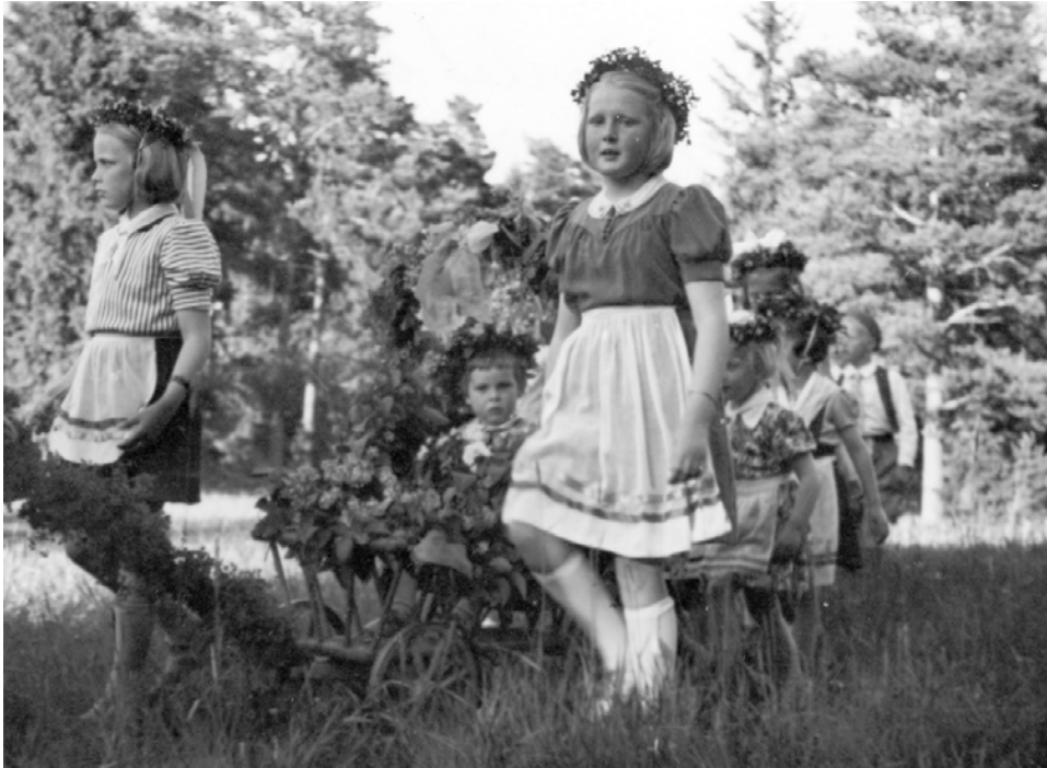
Flickorna drar minsta barnet i den blomsterklädda skrandan.

Järvafältet. Det var militärt område och under kriget var det ständiga övningar mot onde fi. Efter kriget blev det litet lugnare och vi dristade oss in i skogen både vinter och sommar. Tensta skidbacke blev en tilldragelse för hela Spånga (som är värd en egen historia). Men länge efter kunde man hitta patronhylsor och tomma granater, t.o.m. obriserade granater hittades då och då till allmän förskräckelse. Men vad jag vet hände aldrig någon olycka.