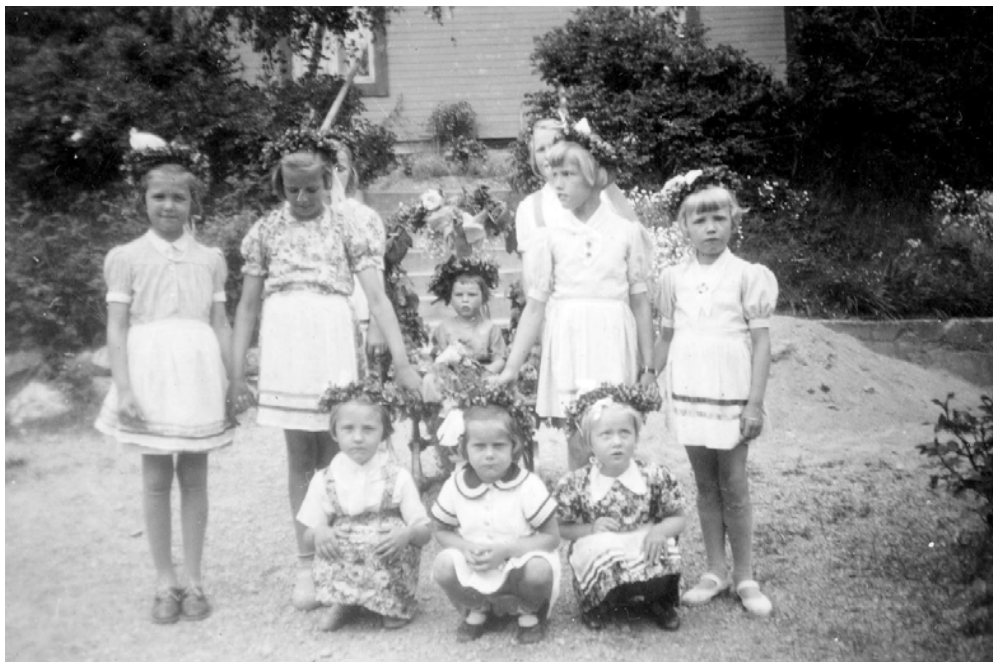
Småflickorna är typiskt klädda i sommarklänningar med förkläden och kransar i håret.

Dagarna innan midsommarafton drog en grupp pappor ut och slog det höga försommargräset med lie. Barnen plockade blommor i mängder, blåklint, prästkragar och olika gula blommor att pryda midsommarstången med. Ormbunkar, fräken, björksly och annat grönt samlades i stora knippen. Allt kördes hem på skottkärra för att förvaras i byttor och hinkar. Pappa gjorde tre stora kransar, en för var ände på korset och en i mitten på stången, hans egen design.