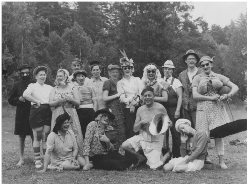
Härligt utklädda fotbollsspelare inför matchen mellan damerna och herrarna.

De äldre tonåringarna och de som var något äldre dröjde kvar till sist och avslutade med en dans borti i vägen som på Frödings tid, men denna gång vid korsvägen i Tensta hage. De som fick vara uppe hela natten drog sedan ut över gården och ängar med förning i bagaget för en pick-nick i det gröna ända bort på Hästa klack i Barkarby. På toppen av berget fanns fundamentet till en luftvärnskanon som bildade ett stort uterum. Där inväntade vi solens uppgång på årets kortaste dag (även om almanackan och verkligheten, då som nu, inte alltid var överens). Midsommarnatten kunde väl innehålla en och annan romans. Alla flickorna plockade sju sorters blommor och lade under huvudkudden när de sent om sidor kom hem.