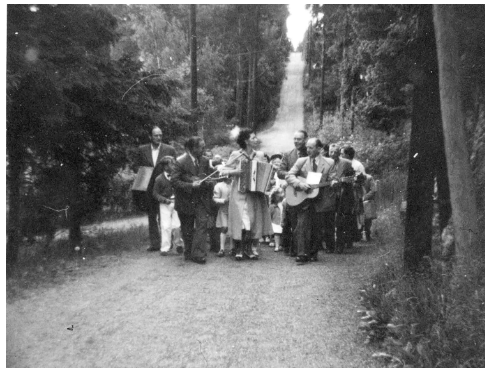
Musiken leder tåget mot midsommarstången i Gläntan i skogen. Vi går längs vad i kallade Trebackarlånggatan, senare omdöpt till Tensta Hagväg och därefter till Kårebacken.