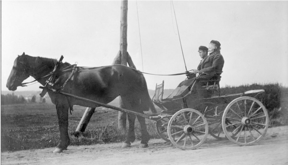
Barnmorskan Poucette på tjänsteärende

insatser, särskilt bland de många fattiga statarfamiljerna med stora barnskaror. Under Första världskriget, då Spanska sjukan raserade som värst, var fru Poucette läkarna behjälplig med att dela ut medicin till sjuka inom Spånga socken.