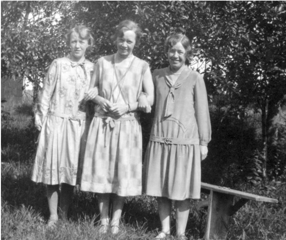
Flickorna Poucette 1926