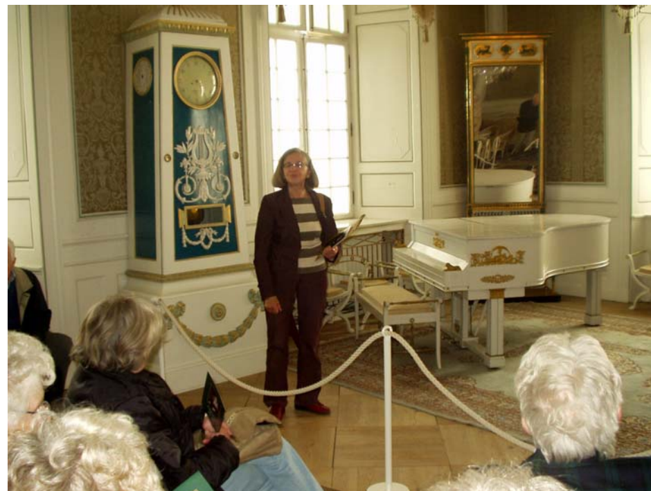
Flöjt-uret på Årsta slott

förgylld säng prydd med keruber fyller sovrummet medan badrummet är mycket rymligt med modernt nedsänkt badkar.