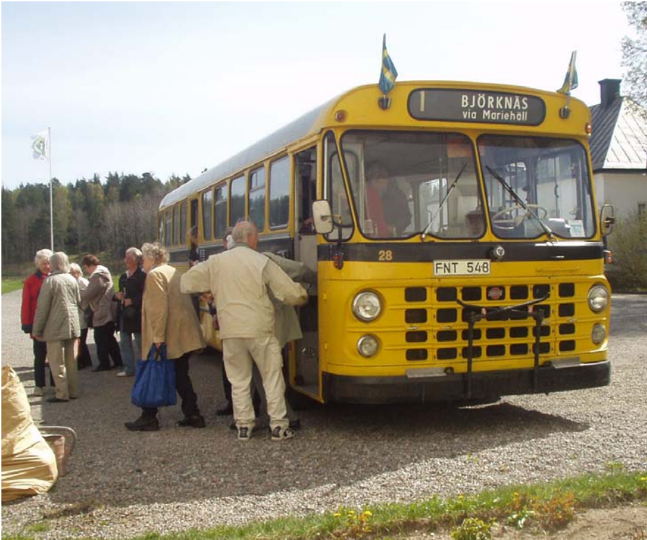
Bussen som transporterade oss i Haninge.

Det finns ett fotografi av en konfirmation i Spånga kyrka år 1937. Flera rader av flickor i långa, vita klänningar med en svartklädd präst längst fram.