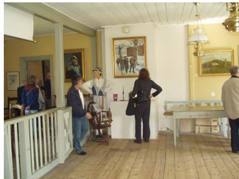
Tingssalen i Sotholms härads tingshus