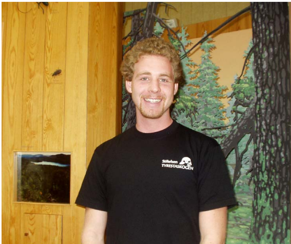
Vår guide i Nationalparkernas hus

Nu bär det av mot Tyresta och Nationalparkernas hus, en märklig byggnad med konturer som en Sverige-karta. Huset har torvtak och grå