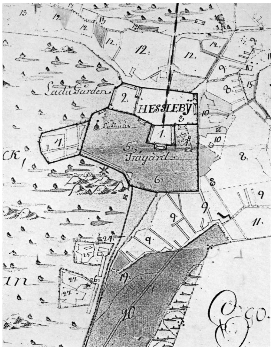
Detalj av karta över Hässelby av Lars Kietzling 1731 på vilken gårdsområdet och vissa vägar markerats. Stockholms Stadsmuseum