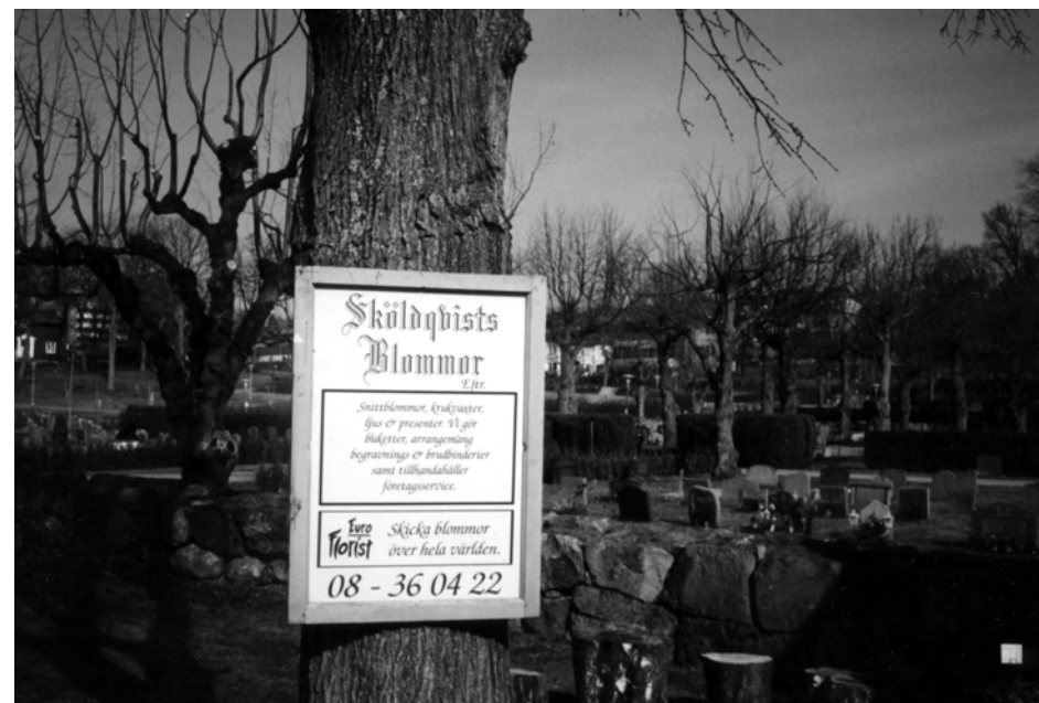
Vid Spånga kyrka

Först till ett företag som drev torghandel i Åkersberga. Sedan kom en ung iranska, som gjorde sina första lärospån som företagare i Sverige. Hon var optimist men omsättningen räckte inte. Företaget stängde efter ett år. Det blev konditori av lokalen.