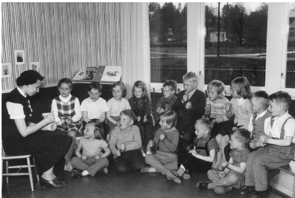
Förmiddagspass på lekskolan 1958

Uppslaget till att med text belysa just denna tid kom sig av att jag för en tid sedan fick ett foto av min mamma, vilket hon hade hittat i en genomgång av det aldrig färdigstädade "hemarkivet".