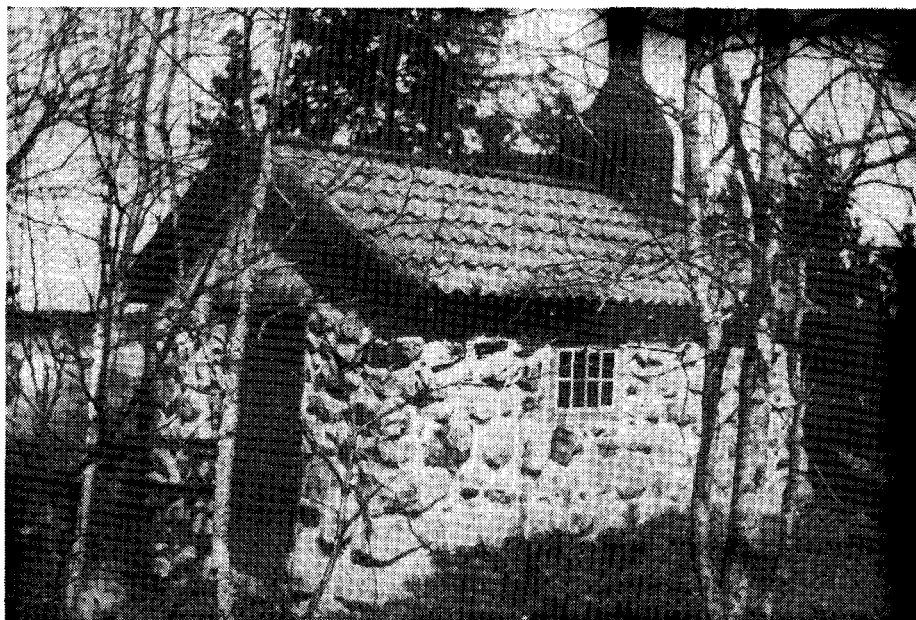
"Kokhuset", 17 april 1921