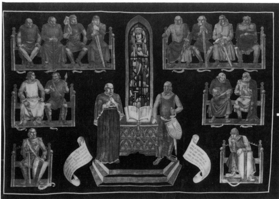
Samhetsbonad i Finstakoret, Uppsala Domkyrka, föreställande ledamöterna för Upplandslagens tillkomst 1296. Figurmålningen är utförd på silkessammet av konstnär Rudolf Gowenius och utgör en gåva från Upplands Fornminnesförening till kyrkans 800-årsjubileum.

De flesta ledamöterna i Upplandslagens nämnd kände säkerligen till den gamla tingsplatsen i Spånga - belägen på nuvarande Järvafältet.