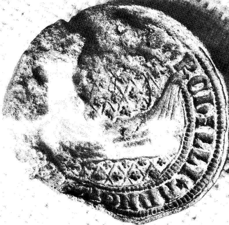
Medeltida sigillstamp av brons från Kymlinge byplats.

En serie C14-analyser av träkol från Kymlinges byplats gav dateringar från ca 400 e Kr till 1400 e Kr. Den äldsta dateringen stämmer väl överens med tiden för det äldsta gravfältets början. Det märkligaste fyndet från byplatsen är en medeltida sigillstamp av brons. På den eldskadade stampen kan urskiljas en klinkbyggd båt med höga stävar på en bakgrund av romber och stjärnor samt bokstäverna "ARNGILL ORCHILLI". Enligt riksarkivets expertis har sigillstampen troligen tillhört Torkel Arn gilsson Barun, som levde på 1300-talet och förde ätten Bååts vapen.