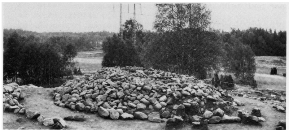
Den stora högen på gravfält 178 vid Rinkeby under utgrävning; jordmanteln är borttagen och kärnröset framrensat.

Inom RINKEBY undersöktes och borttogs sent ligo fornlämningar. Den största högen på gravfältet nr 178, av Spångaborna kallat "Kinnekulle", har återställts efter undersökningen. Liksom Tensta förefaller Rinkeby ha haft fast bosättning sedan folkvandringstid. Även här var de yngsta gravarna anlagda på 1000-talet och helt kristna till formen. Förleden i namnet Rinkeby utgörs av det fornsvenska ordet "rinker", som betydde krigare. Mot den bakgrunden är det intressant, att det just i Rinkeby påträffades vapen i flera gravar. Sådana har annars varit sällsynta fynd på Järvafältet. Här fanns också det ovan nämnda gravfältet med flera ovanligt stora gravhögar. Det anses vara gravar som tyder på hög social status.