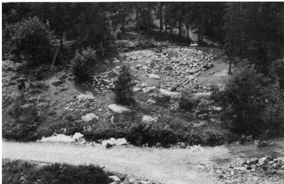
Bronsåldersgravfältet nr 134 i skogen NO om Akalla under utgrävning. Foto från NV.

AKALLA och området närmast byn har bevarats som kulturpark i den nya bebyggelsen. Här har endast mindre arkeologiska undersökningar gjorts. Här kan ha funnits bebyggelse av mer permanent slag redan under bronsåldern (ca 1500-400 f Kr). På det tyder bl a ett litet gravfält med sex gravar från denna tid, som stadsmuseet undersökte 1974. Två av gravarna var s k mittblocksstensättningar, en gravform som är karaktäristisk för bronsålder i denna del av Sverige. Samtliga gravar var brandgravar. Det enda bronsföremålet var en liten spiral. En liknande påträffades omkring 1960 på bronsåldersboplatsen vid torpet Plaisiren i Vinsta i södra Spånga.