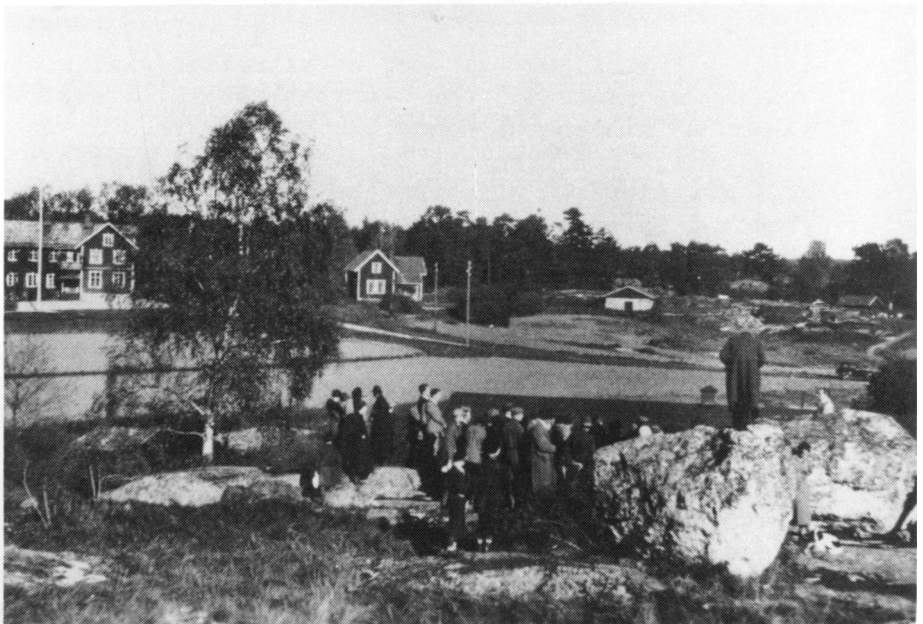
Foto 1933 från en av Gillets första utflykter visar platsen för nuvarande Vällingby Centrum. De stora flyttblocken och en skålgropssten har bevarats till eftervärlden.