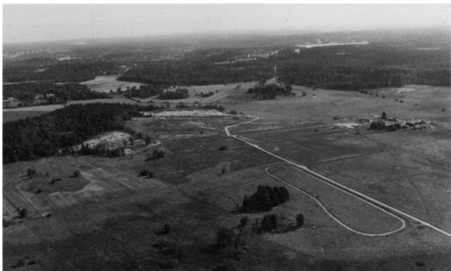
Ärvinge gård med två av de stora järnåldersgravfälten under utgrävning. Flygbild från SV. Godkänd för publicering.

Det andra nya gravfältet upptäcktes sent på hösten 1976 alldeles intill gården, i samband med att en parkväg skulle anläggas. Gravfältet var skadat och gravarna hade inte kvar några synliga markeringar ovan jord. Totalt framkom rester av ca 20 gravar från vendel- och vikingatid. Två av dem var skelettgravar, av fynden att döma anlagda på 800-talet. Den ena graven var en kvinnograv med mycket förnämliga gravgåvor, bl a två dubbelskaliga s k spännbucklor och armbyglar av brons. Graven är rekonstruerad i stadsmuseets nya arkeologiska basutställning "Fornetid", som öppnades 1981. Skelettet var ovanligt välbevarat. Den dödas ålder har kunnat bestämmas till ca 60 år och kroppslängden till ca 170 cm.