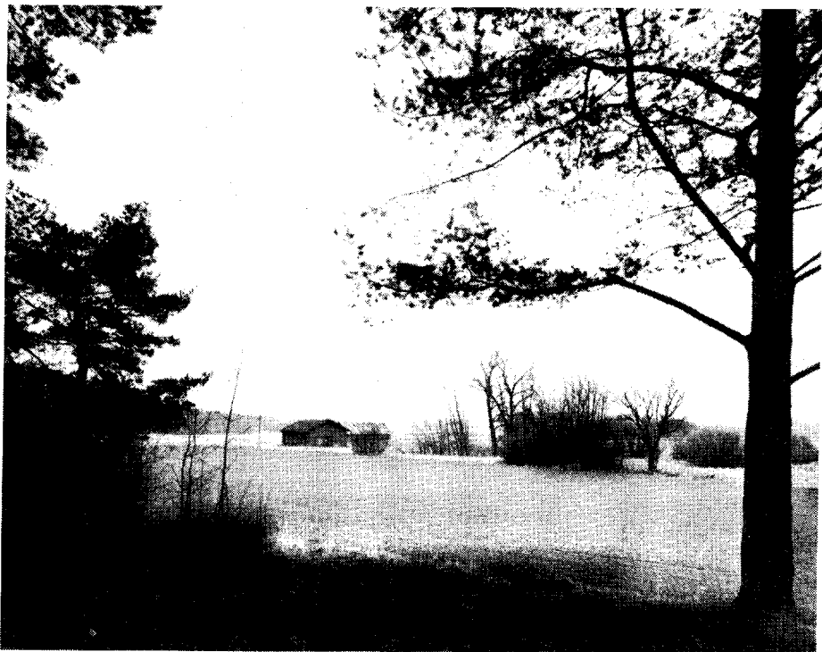
Kymlinge byplats. Foto från NO före undersökningen 1973.

Vid Kymlinge undersöktes också den äldre bytomten, som utnyttjades till omkring 1920. Härvid framkom en stor mängd konstruktioner av olika slag: stolphål, härdar, stenplintar, sotfläckar etc. Det var dock mycket svårt att finna ett sammanhang mellan alla dessa anläggningar, vilket torde bero på att platsen varit kontinuerligt bebyggd under ca 1500 års tid. Andra byplatsundersökningar har givit liknande svårtolkade resultat.