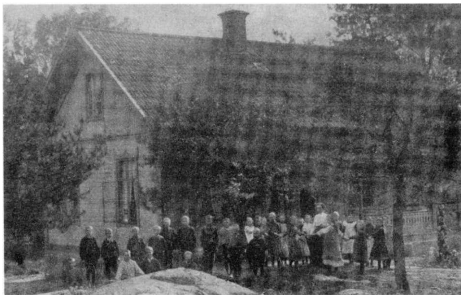
Ervinge skola 1906.

De gamla arbetarbostäderna intill gården har sparats och ger än i dag intryck av äldre bruksmiljö. Husen har nyligen reparerats och är bebodda.