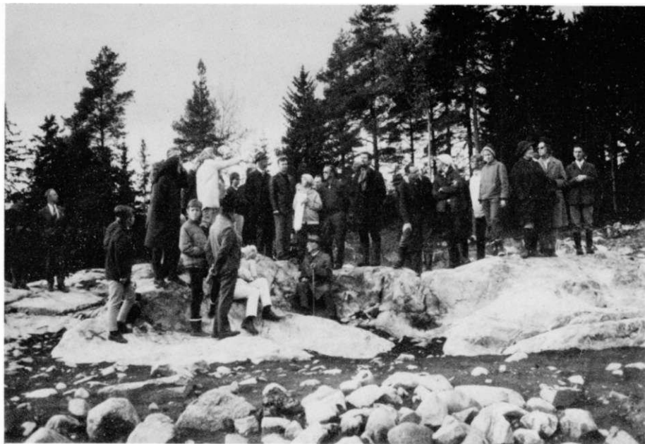
Gillesmedlemmar besöker Stadsmuseums utgrävningar vid Ärvinge gravfält (intill Kista Centrum)