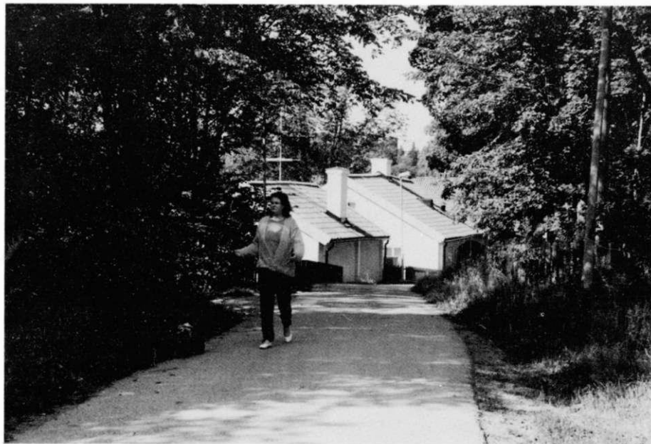
De gamla arbetarbostäderna vid Kista gård ger än i dag intryck av äldre bruksmiljö.